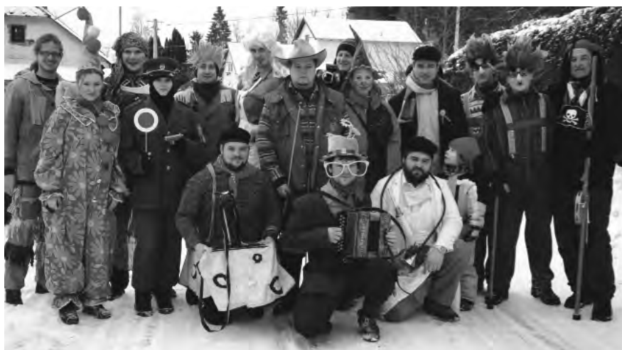
Účastníci maškarního průvodu v Michalově.