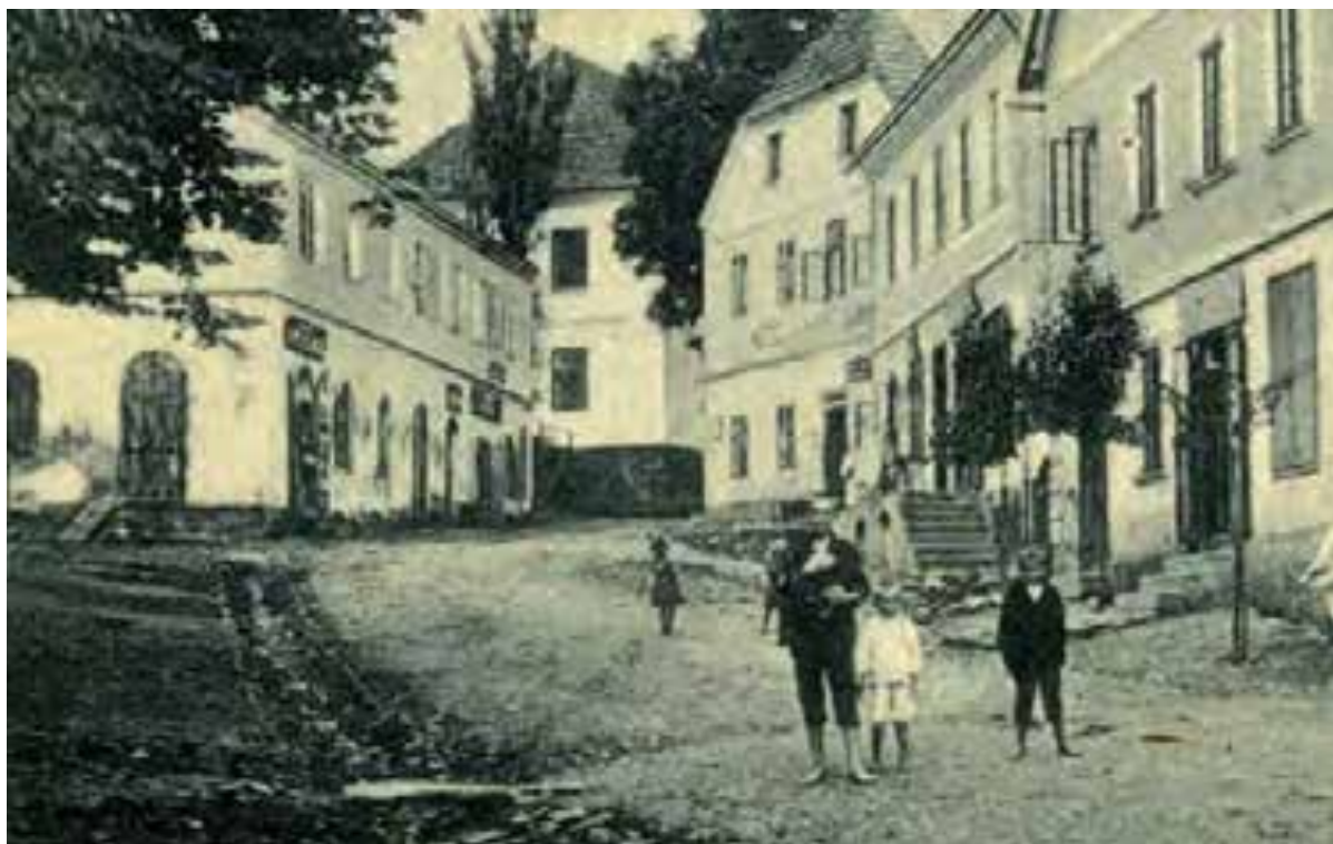
Dům „U Šafránků“ (vlevo), vpravo v pozadí hotel „U Lva“. Kanalizace na povrchu.