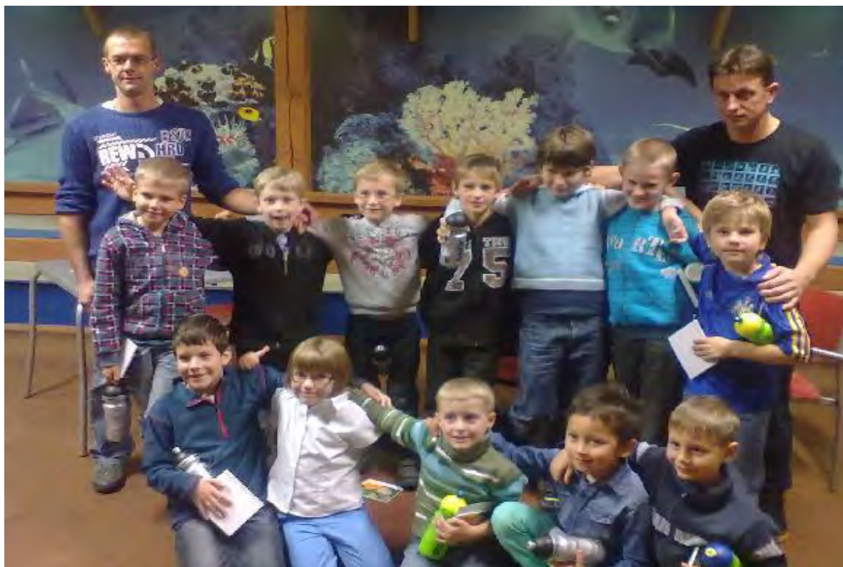
foto ze společného posezení mladší přípravky Sokola Stachy/Zdíkov k závěru podzimu 2013

Přejme si, ať dětem toto nadšení vydrží co nejdéle, aby mohly trenérům, rodičům a všem příznivcům sportu v našich obcích dělat do budoucna radost svými výkony.