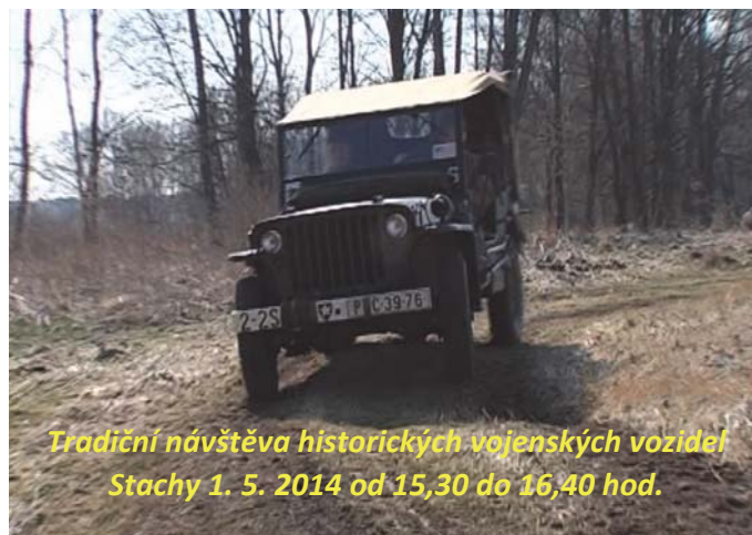
Tradiční návštěva historických vojenských vozidel Stachy 1. 5. 2014 od 15,30 do 16,40 hod.