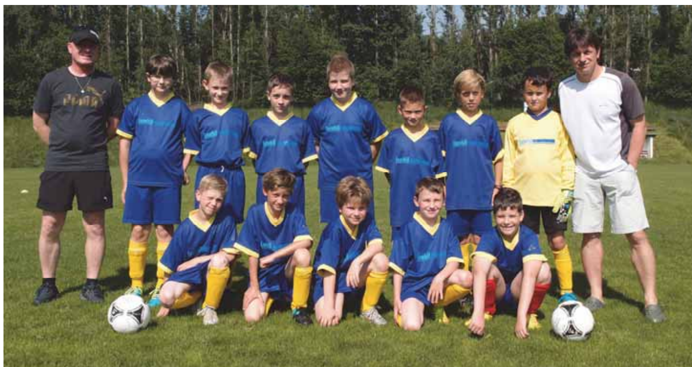
Starší příprava před jedním z mistrovských zápasů na domácím hřišti