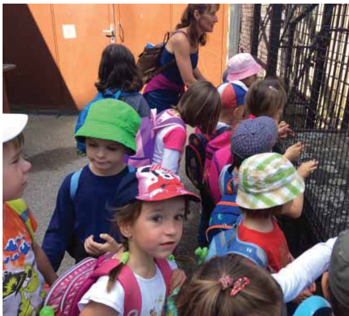
Výlet do ZOO Hluboká n/Vlt. 25. 6.