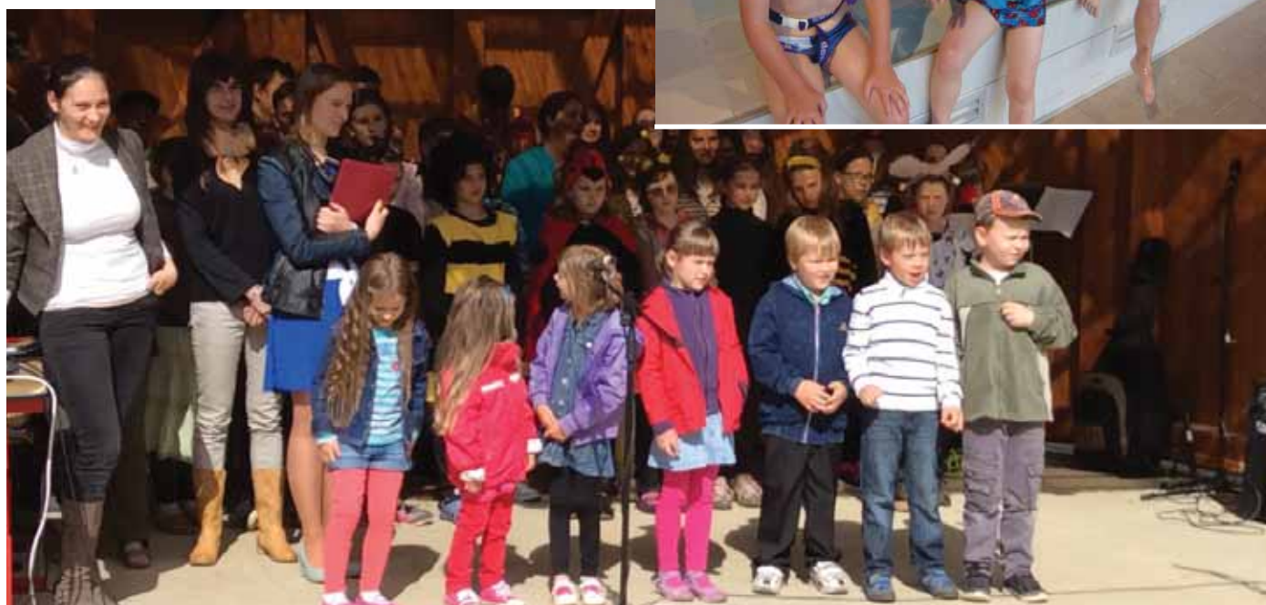
Pasování předškoláčků na prvňáčky