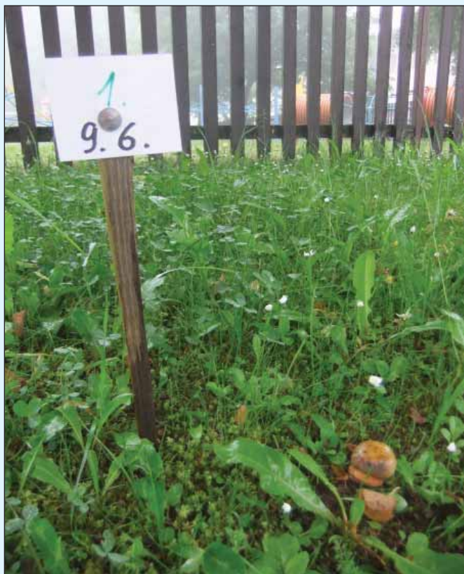
První letošní hřib se v našem parku objevil v úterý 9. června