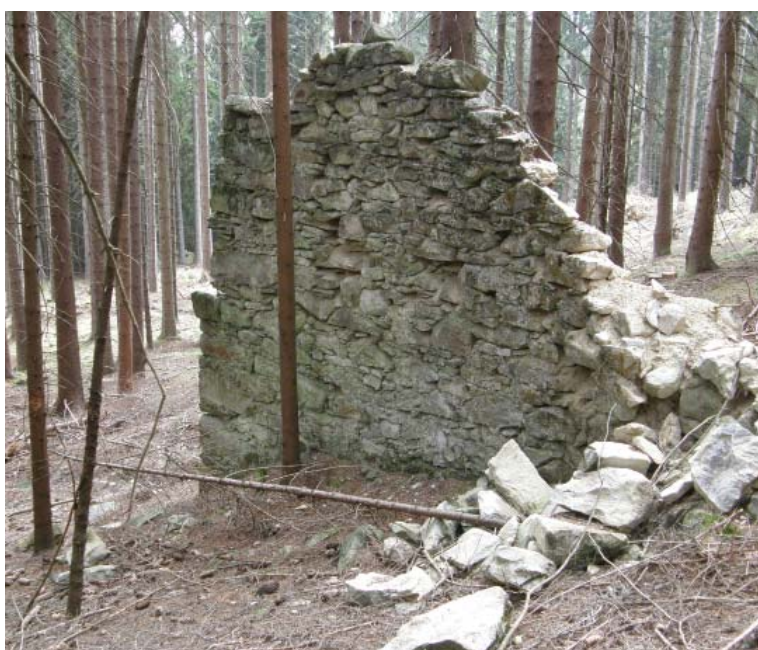
Střilna v Huti