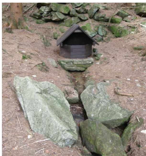
Studánka v huti