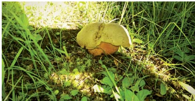
Foto: první letošní hříby koloděje nedaleko stašského kostela dne 08. 06. 2016.