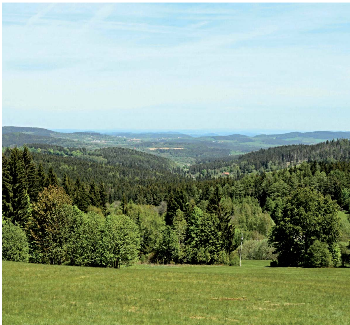
Pohled ze Zadova do Stašské kotliny

dovolujeme si Vám touto cestou přiblížit program stašské poutě a další zprávy ze života obce. Spolu s vydáním tohoto Stašska přichází letní období a s ním se blíží nejen samotná pouť, ale i doba prázdnin a pro mnohé formou dovolených určitě také zasloužený odpočinek uprostřed roku. Přejeme Vám k tomu zejména pohodu, získání nových sil do práce a také šťastné návraty z cest.