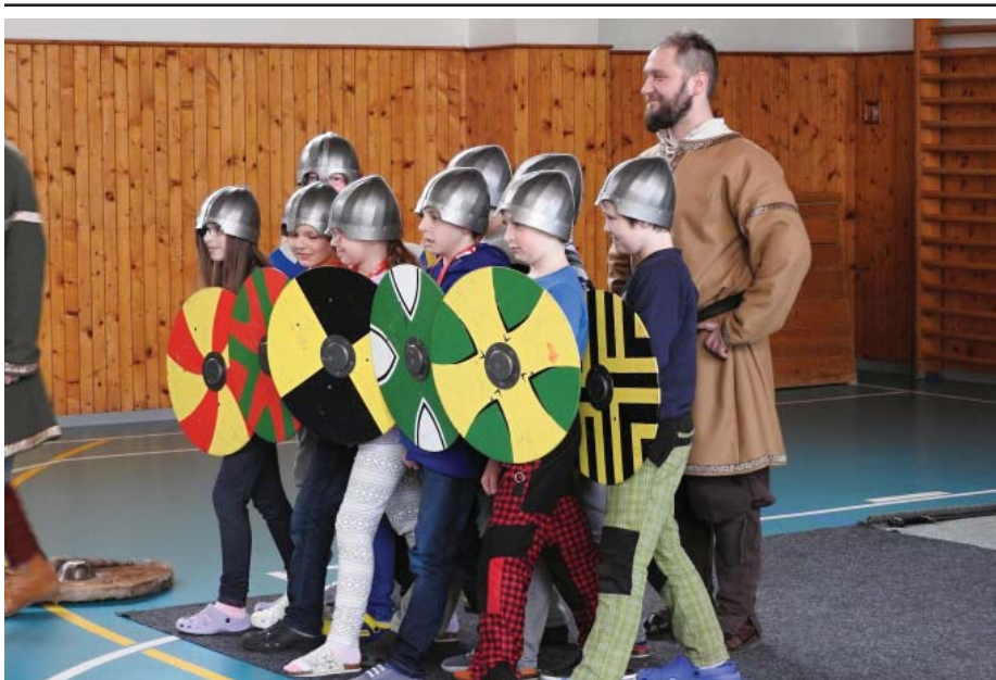
Perštejní nám přiblížili život Vikingů