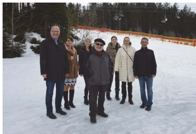
Ze setkání zástupců obcí Stachy a Ruderting