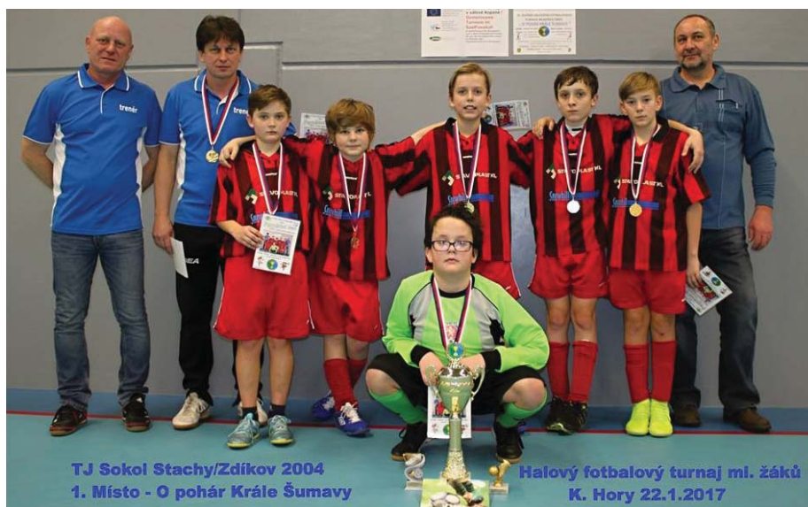
TJ Sokol Stachy/Zdíkov 2004