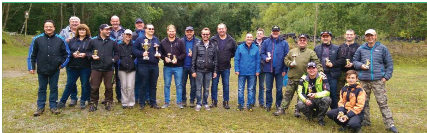
Společné foto soutěžících