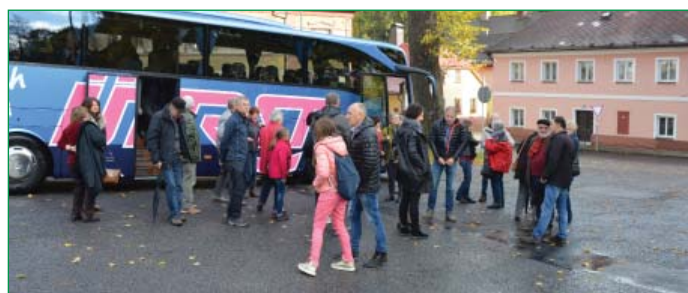
Přivítání ve Stachách