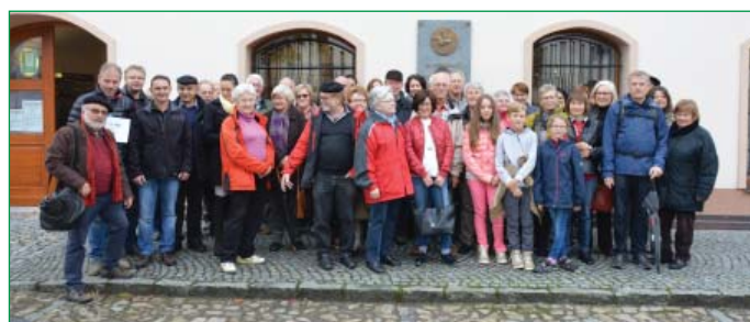
Společné foto před Muzeem Šumavy