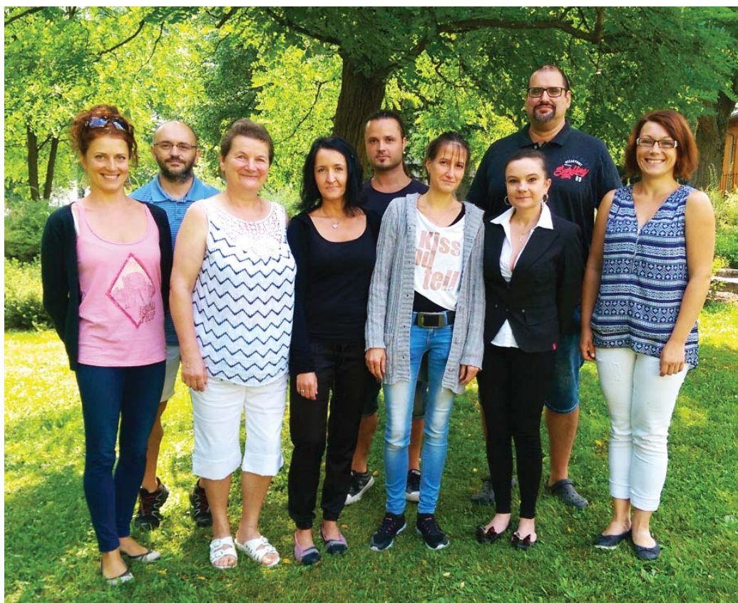
Pedagogický sbor ZUŠ Stachy

hou jejich děti v tamější škole navštěvovat odloučené pracoviště Základní umělecké školy Stachy. O přesných datech koncertů Vás budeme informovat pomocí plakátů a facebookových stránek školy. Přeji Vám krásné podzimní dny a těším se na společná setkání v naší „ZUŠce“.